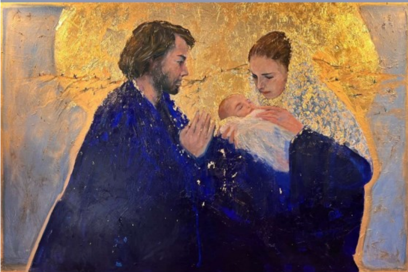
« Nativité » (2010) - Huile et feuille de couleur or sur toile de lin - 195 * 130 cm

Église Saint Jean l'Évangéliste, 25, rue Clément Jannequin 86100 Châtellerault